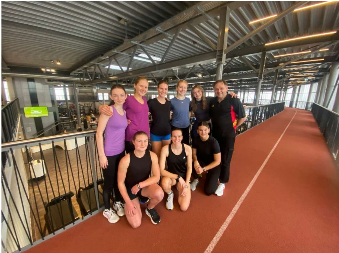
Laufgruppe in der DiezArena